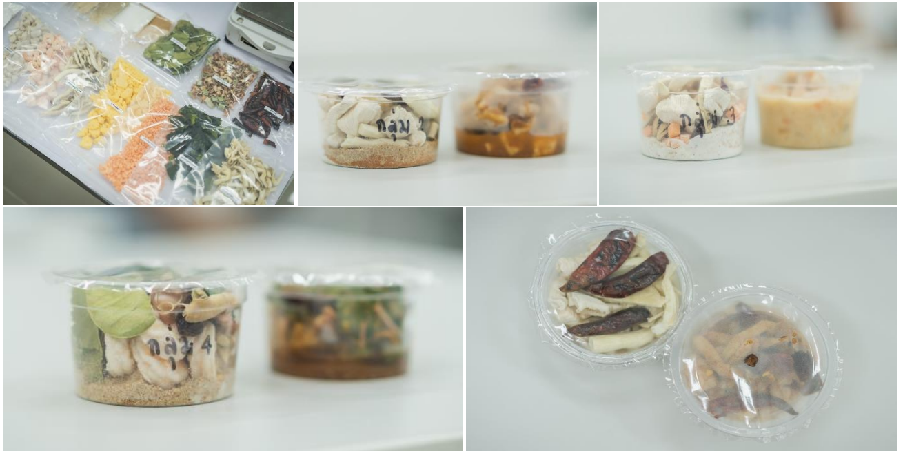
ภาพตัวอย่างผลิตภัณฑ์ในโครงการ