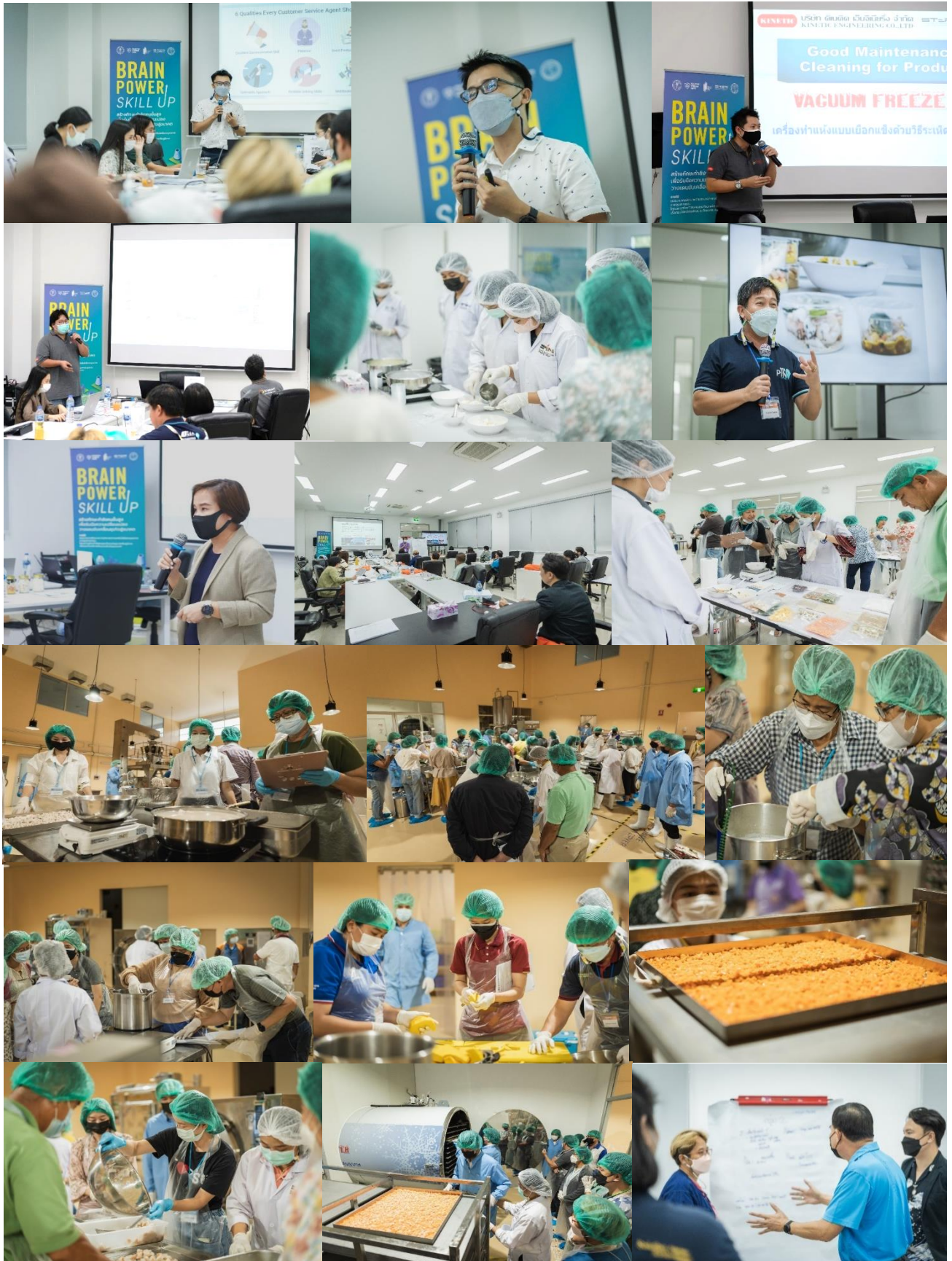
ภาพการดำเนินงานในโครงการ